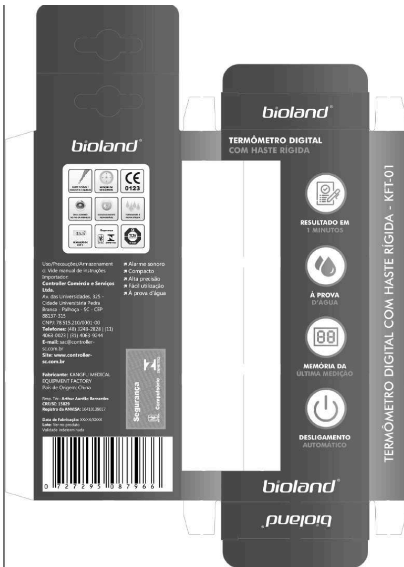
QUADRO ANEXO À PORTARIA INMETRO/DIMEL N.º 181, DE 22 DE AGOSTO DE 2023